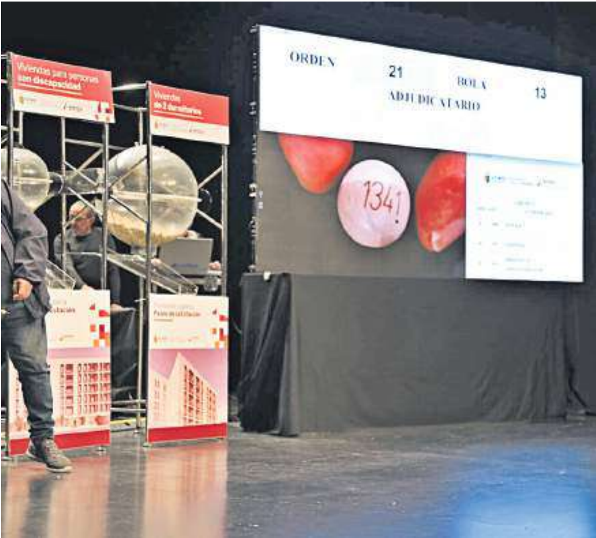
Adjudicadas por sorteo las 23 viviendas públicas del Paseo de la Estación en Getafe PÁGINA 13