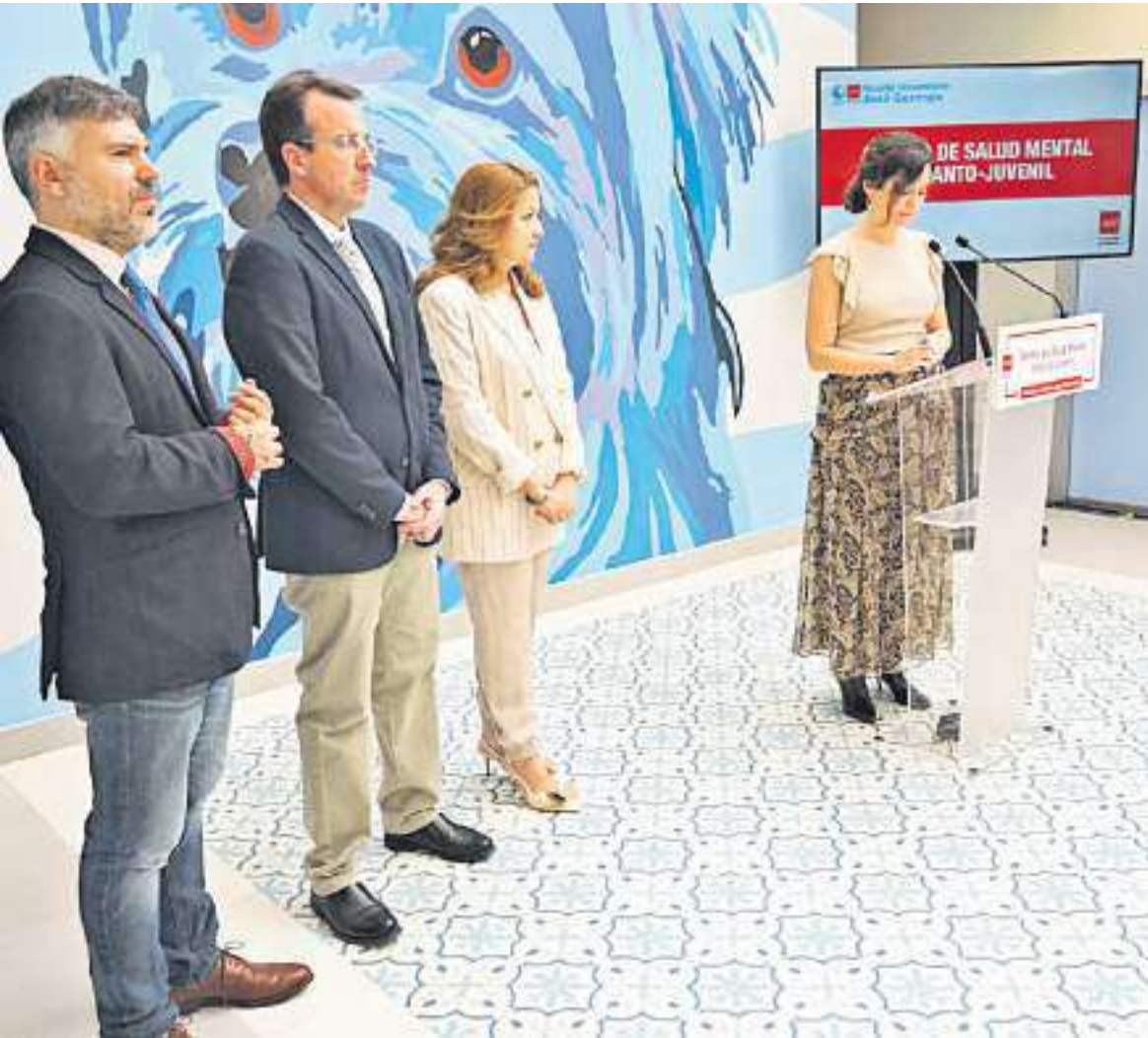
La presidenta de la Comunidad inaugura en Leganés un nuevo centro de salud mental infanto-juvenil PÁGINA 7