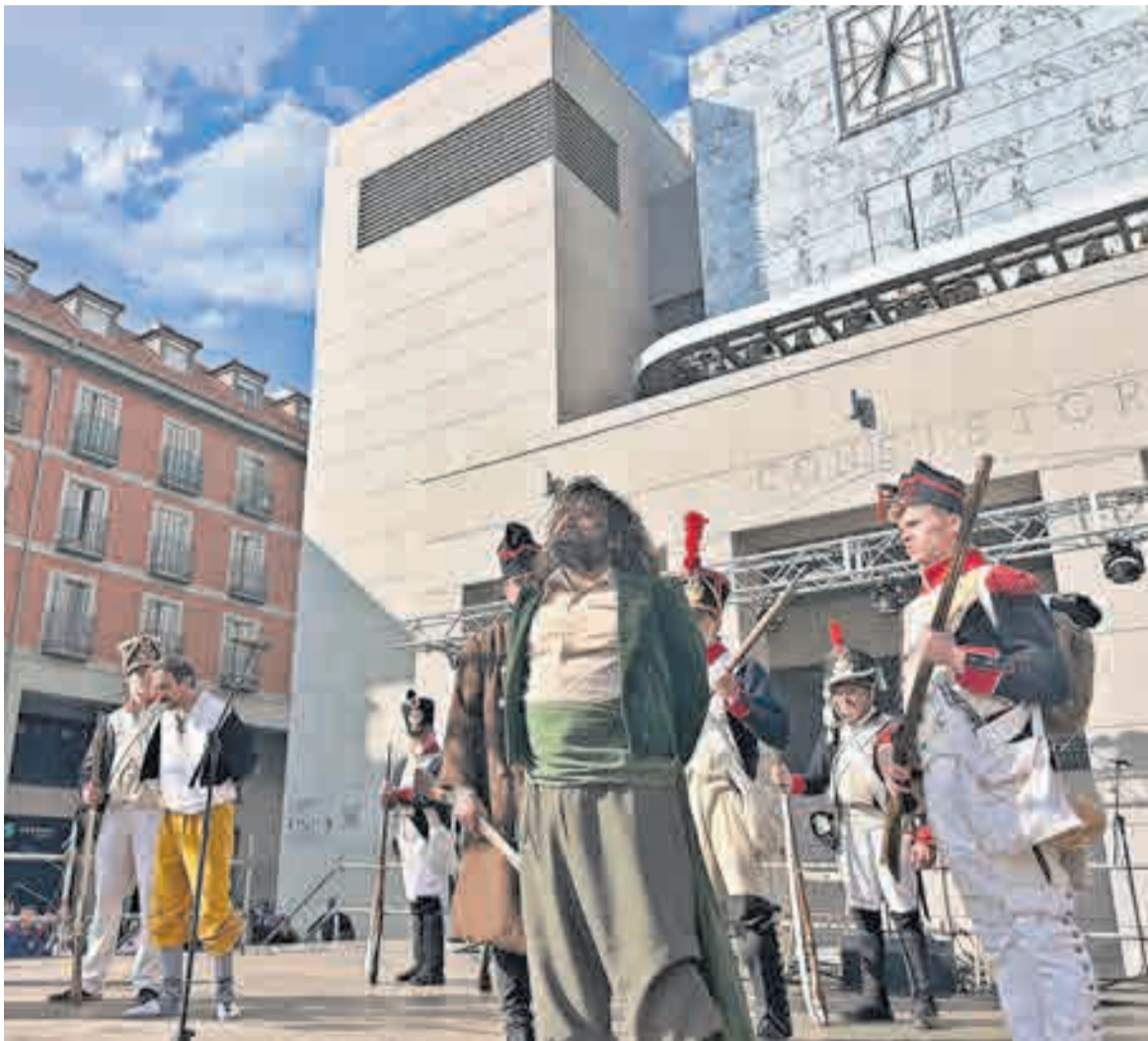
Vuelven las Mayas, la recreación histórica de los Hermanos Rejón y la fiesta de los Gabarreros en Leganés PÁGINA 14