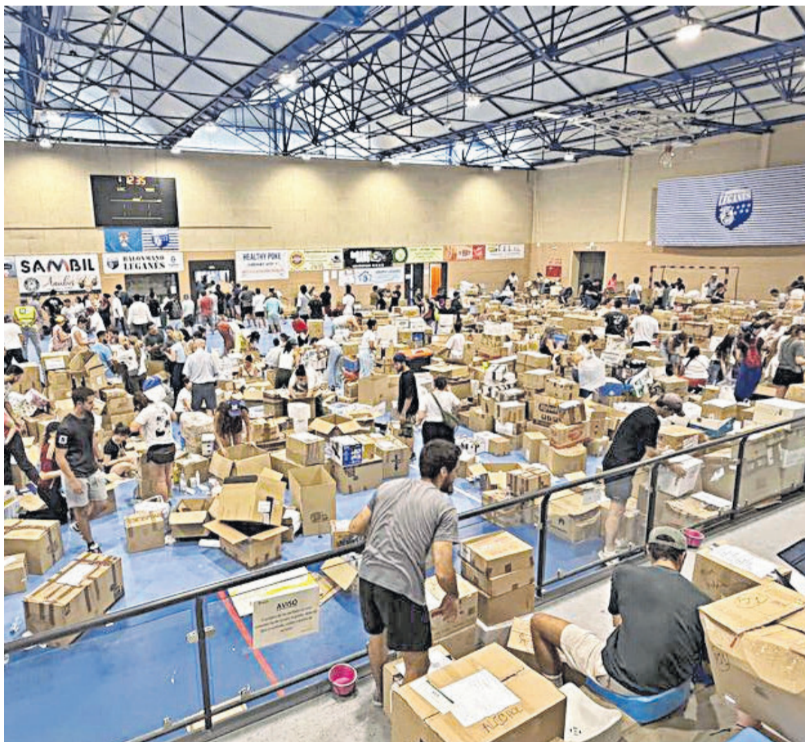
El Ayuntamiento de Leganés cede el pabellón Manuel Cadenas para recoger material para Venezuela PÁGINA 10